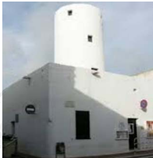
Molí de Baix